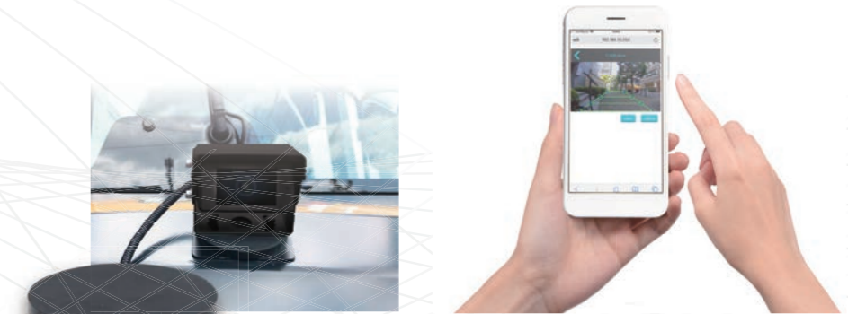
機械本体へはマグネットで取付可能