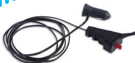
全旋回グラスパー ダイナ リモコン送信機セット